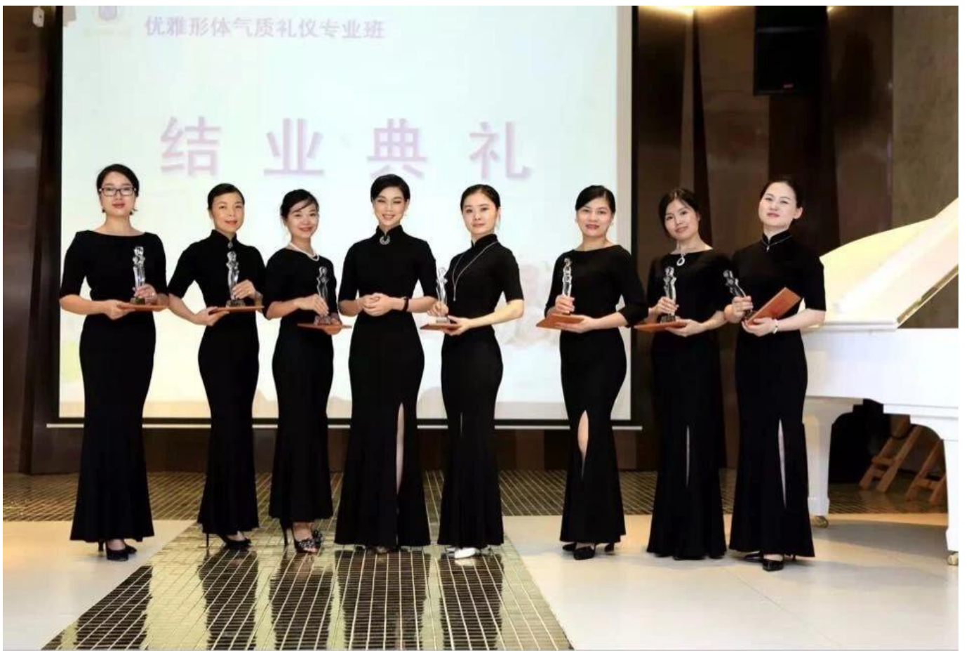
Amazon Elite Training: