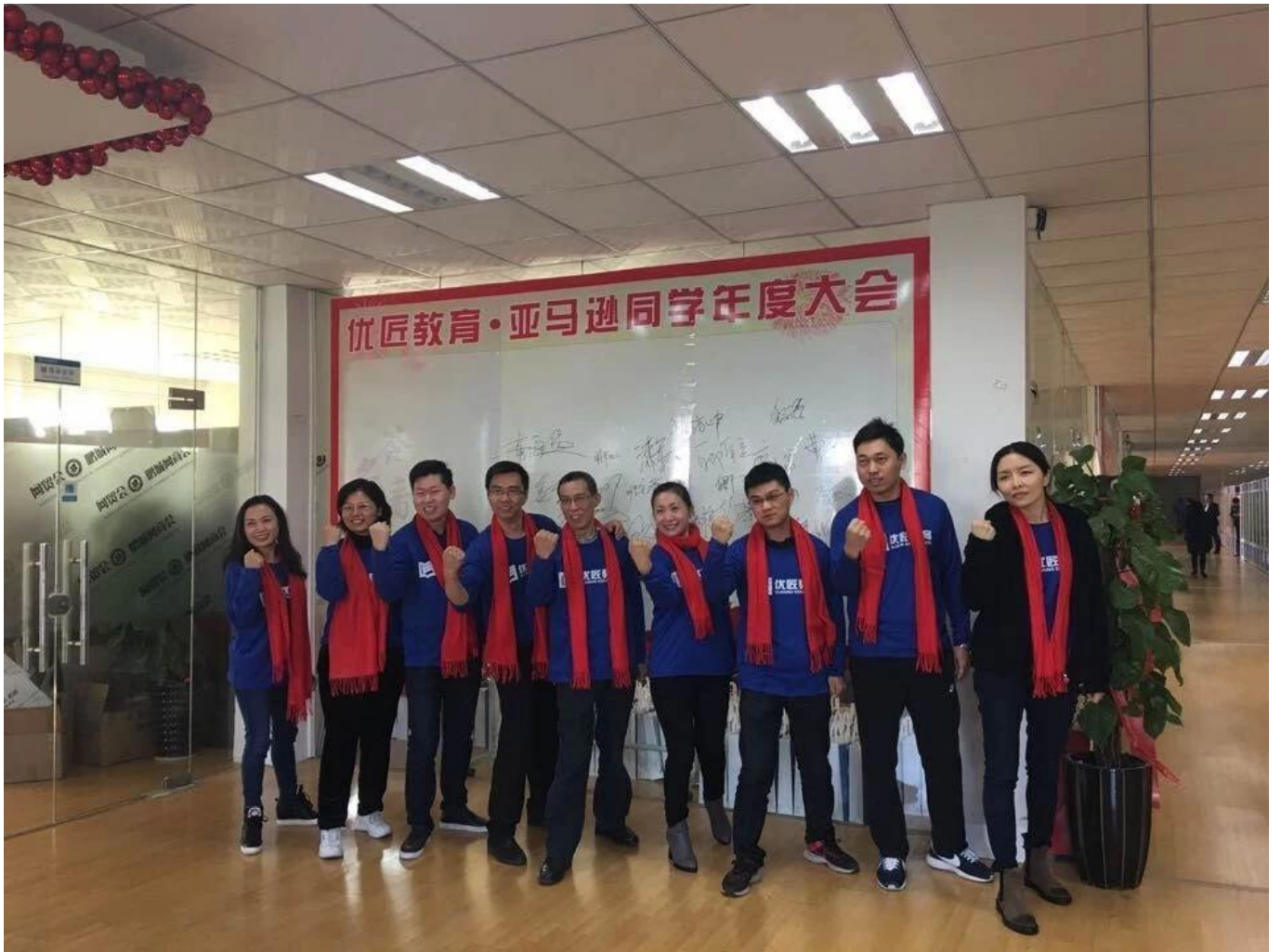
Ausgezeichnete Mitarbeiter