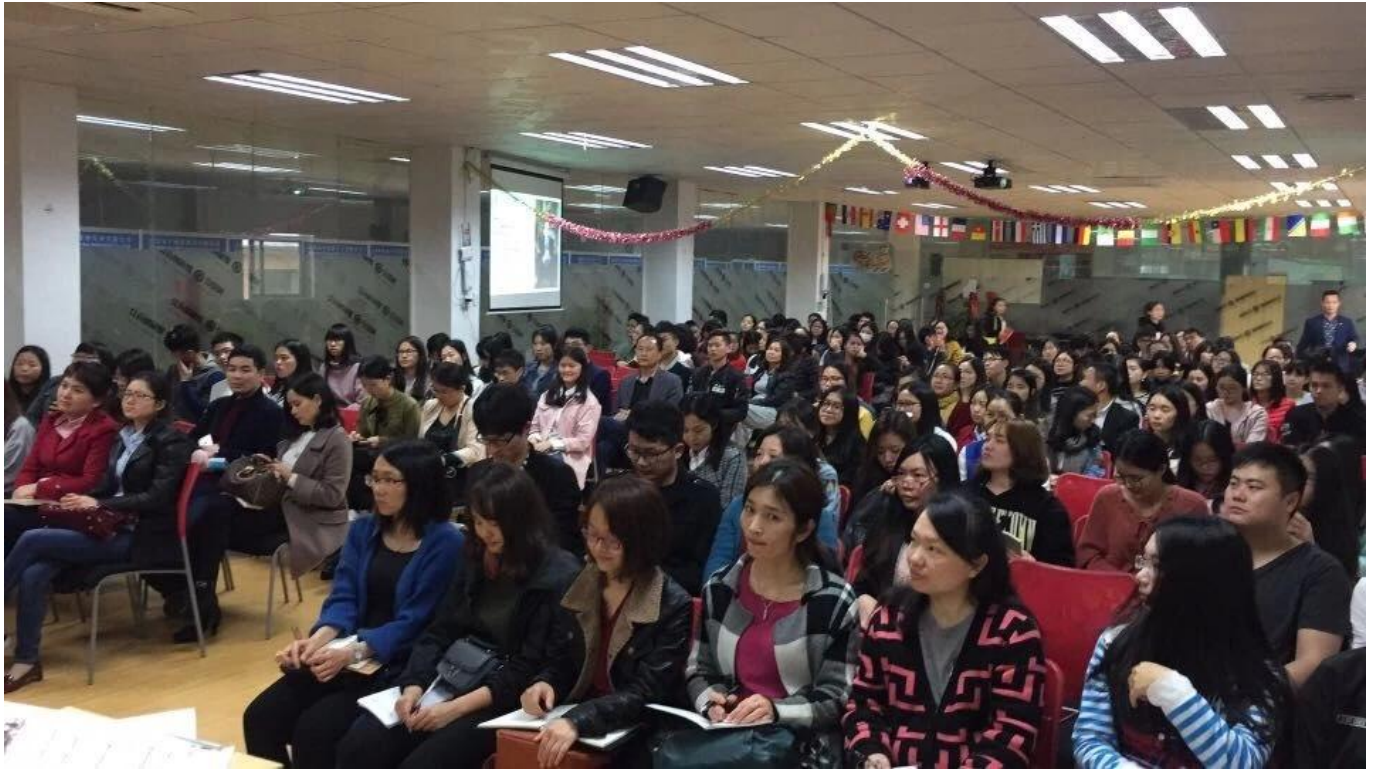
Office Clerk Temperament Training: