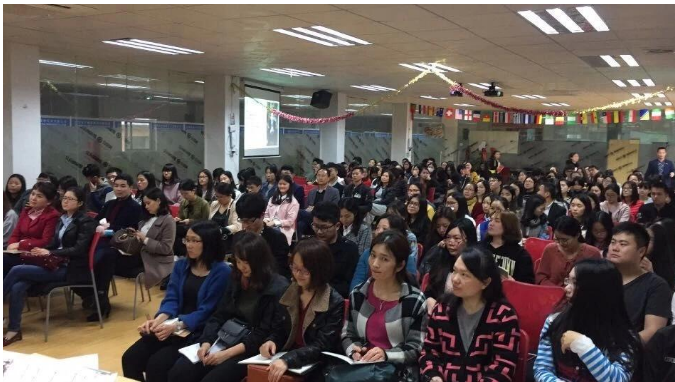
Entrenamiento del temperamento del oficinista de la oficina: