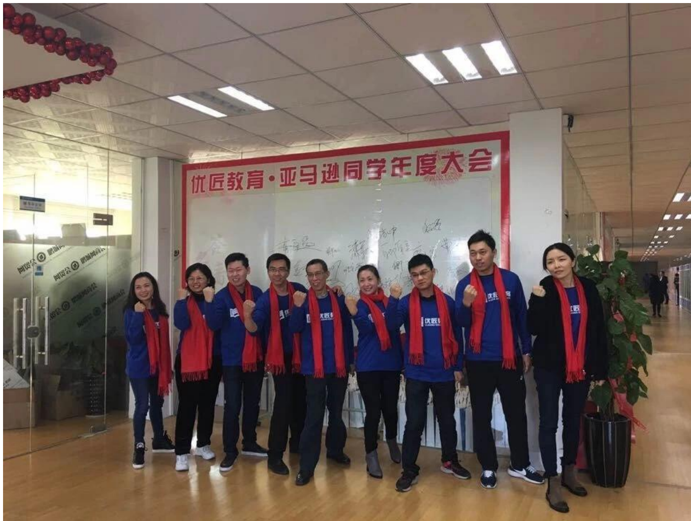
Excelente foto del personal: