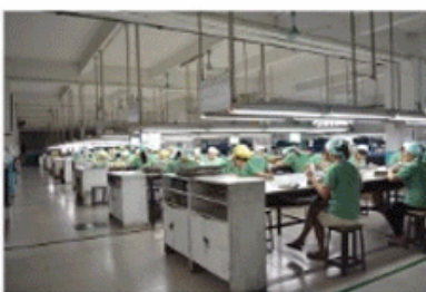
Color Filled in